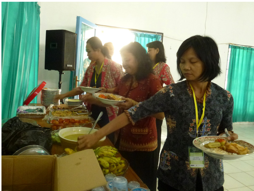
Peserta mengambil makan siang