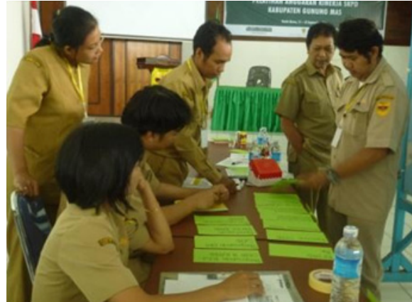
Peserta berkerja dalam kelompok untuk tugas perencanaan tahunan pemerintah