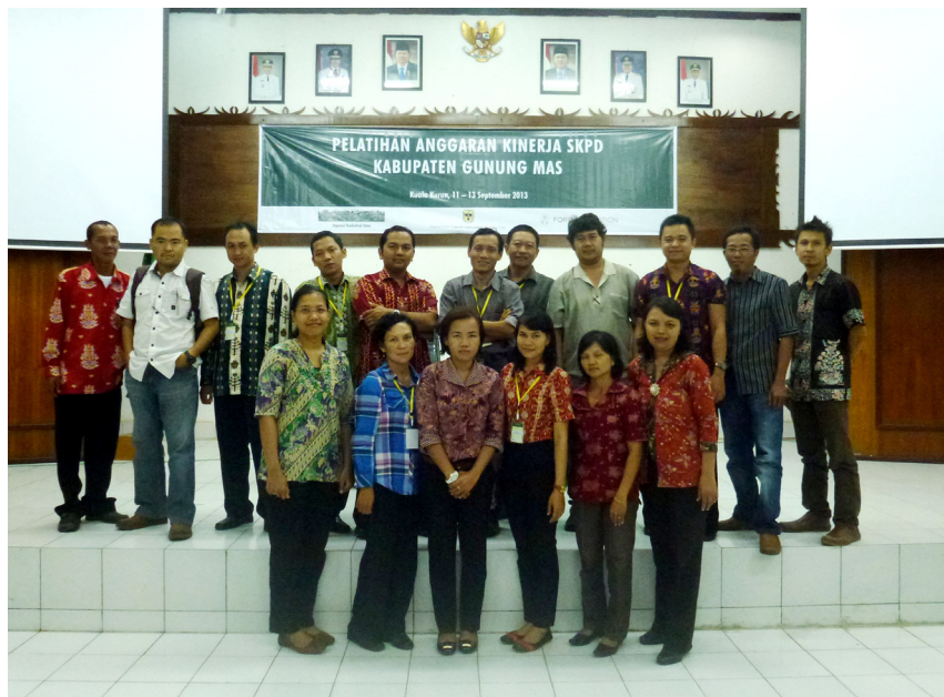
Seluruh peserta pelatihan anggaran berbasis kinerja