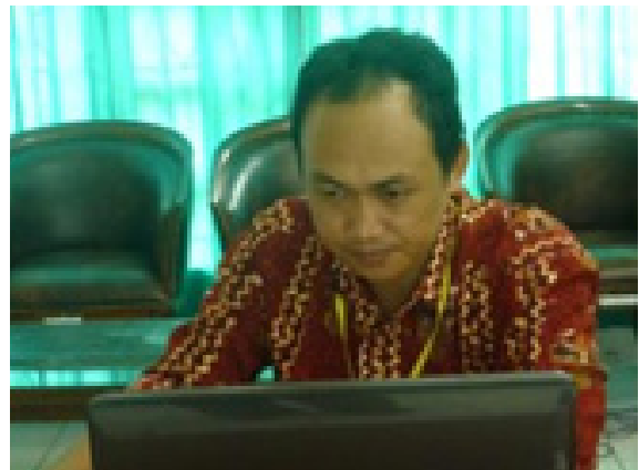
Ekspresi peserta ketika menganalisis Renstra dan Renja