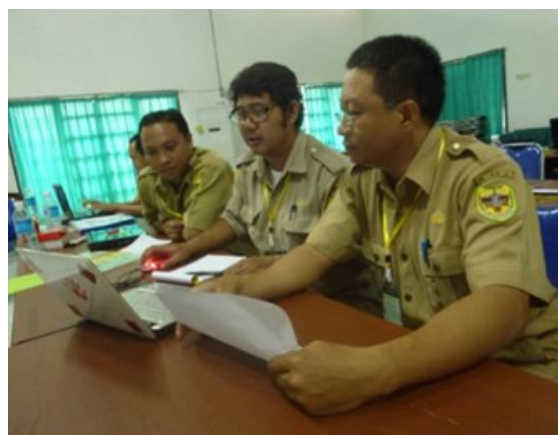
Peserta sedang mengerjakan tugas analisis Renstra dan Renja