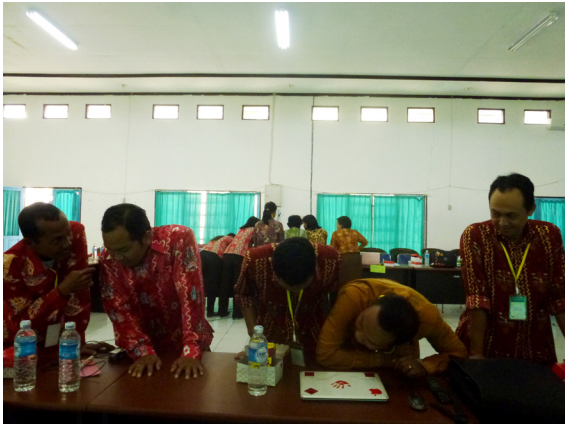
Peserta mempersiapkan strategi untuk game