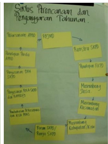
Hasil kerja kelompok 1, 2, 3 works tentang siklus perencanaan tahunan