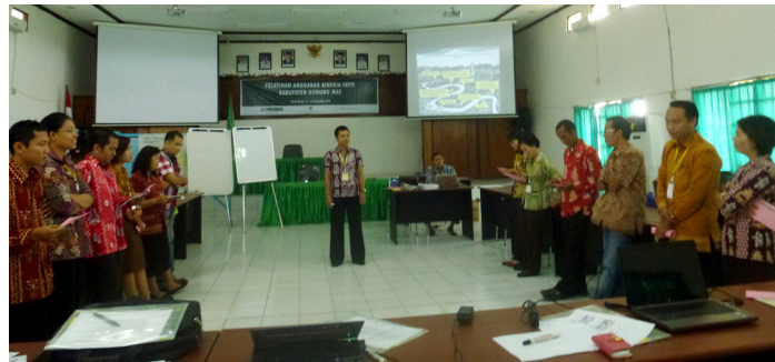
Sesi Review– Hari 2