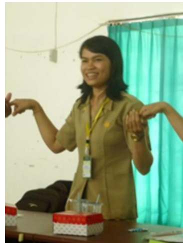
Ice breaker “Menangkap Jari”