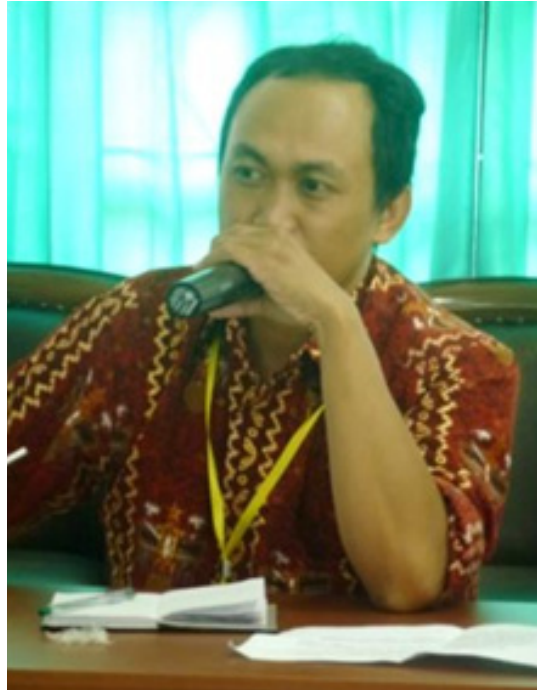
Beberapa ekspresi peserta ketika memberikan saran untuk RKA yang lebih baik.