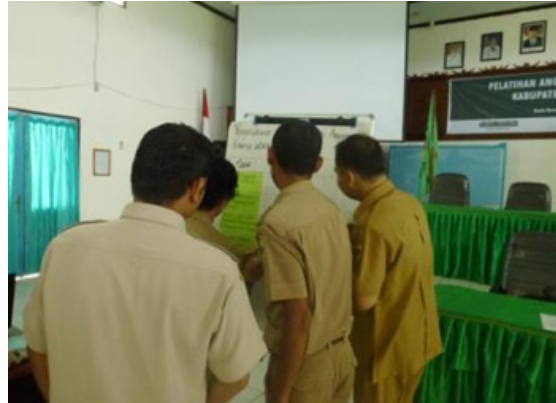
Peserta mengisi format identifikasi kebutuhan pelatihan