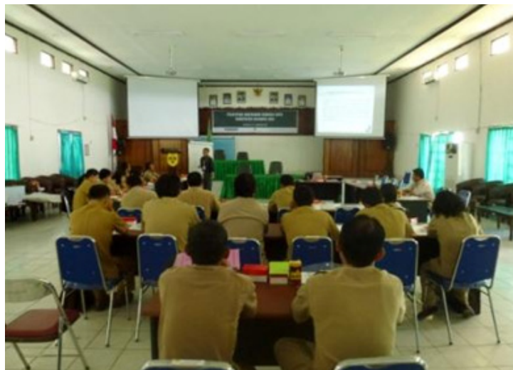
Presentasi dan diskusi pleno tentang prinsip anggaran berbasis kinerja